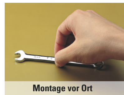
Montage vor Ort

Pflege unter optimalen ergonomischen Bedingungen? – Wir beraten Sie gerne!